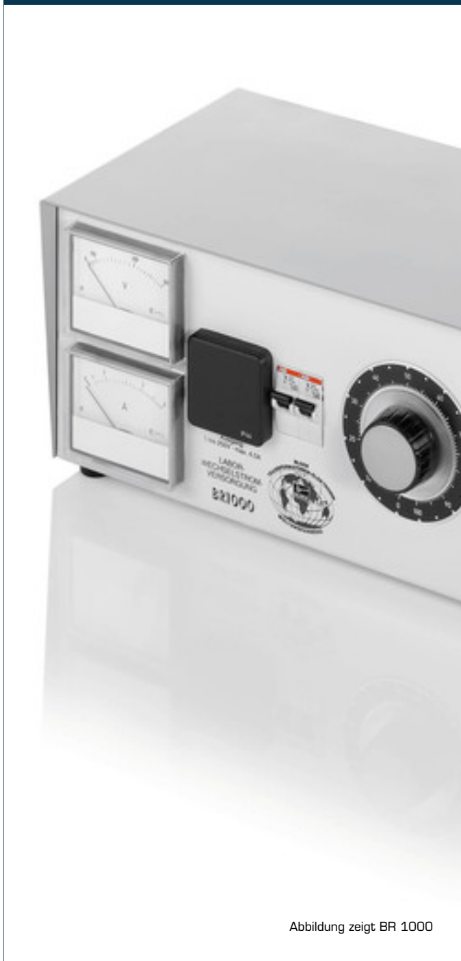
Abbildung zeigt BR 1000